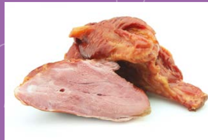
CARNE AHUMADA DE PORCINO